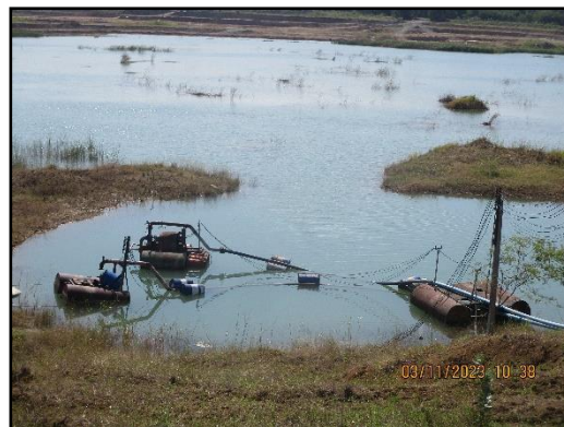
ภาพที่ 2.23 บ่อรวบรวมน้ำ (Sump)