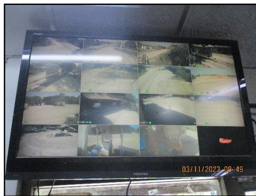
ภาพที่ 2.27 การติดตั้งกล้องวงจรปิดภายในพื้นที่โครงการ