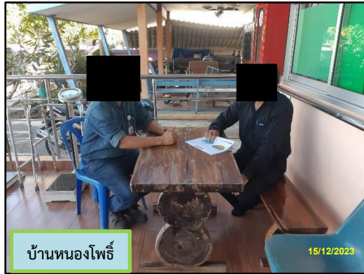
บ้านหนองโพธิ์