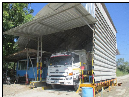
ภาพที่ 2.24 ด้านซังน้ำหนักรถบรรทุกขนส่งแร่