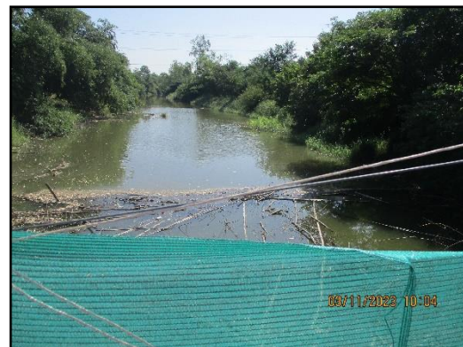
ภาพที่ 2.8 คลองห้วยแร่