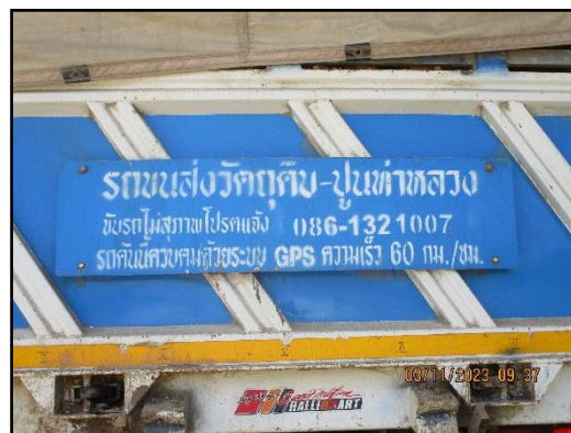
ภาพที่ 2.13 รถบรรทุกที่มีการติดชื่อโครงการ และหมายเลขโทรศัพท์