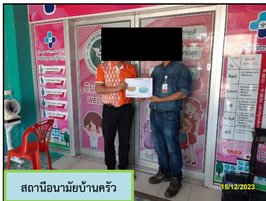
สถานีอนามัยบ้านครัว