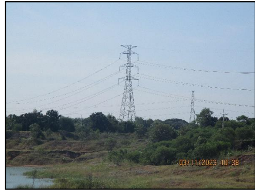
ภาพที่ 2.3 การเว้นระยะห่างจากแนวสายไฟ