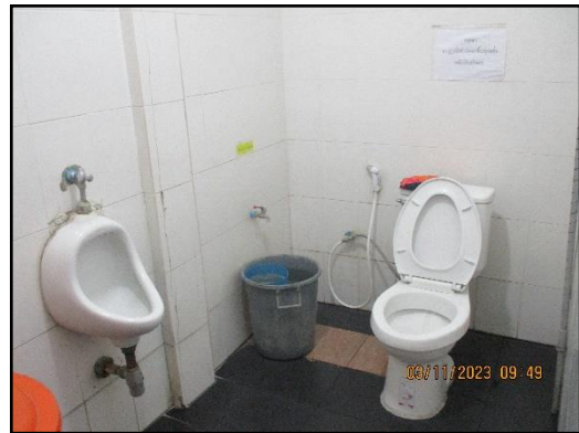
ภาพที่ 2.18 สุขาภายในพื้นที่โครงการ