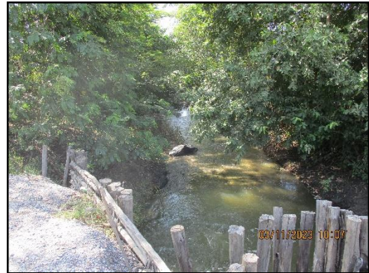
ภาพที่ 2.9 คูระบายน้ำด้านนอกคันทันบ