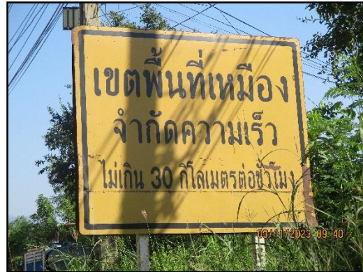
ภาพที่ 2.12 ป้ายจำกัดความเร็วไม่เกิน 30 กิโลเมตร/ชั่วโมง