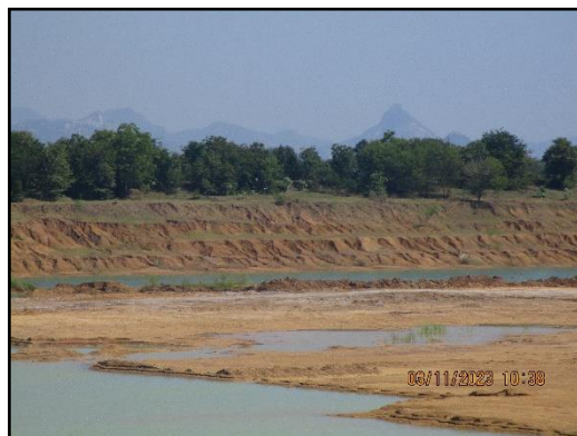
ภาพที่ 2.19 การเปิดหน้าเหมืองในลักษณะชั้นบันได