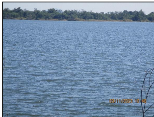
ภาพที่ 2.20 จุดรับน้ำเพื่อนำมาฉีดพรมถนนลำเลียงแร่