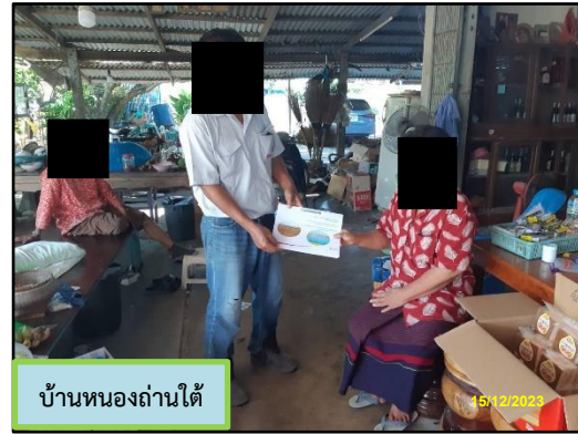
บ้านหนองถ่านใต้