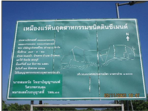
ภาพที่ 2.15 ป้ายประทานบัตร