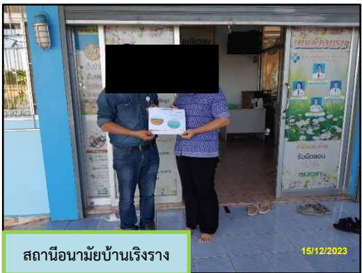
สถานีอนามัยบ้านเริงราง