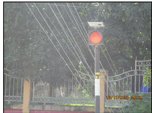
ภาพที่ 2.11 ป้ายจราจร และสัญญาณไฟให้ชะลอความเร็วบริเวณช่วงก่อนเลี้ยวเข้า-ออก พื้นที่โครงการ