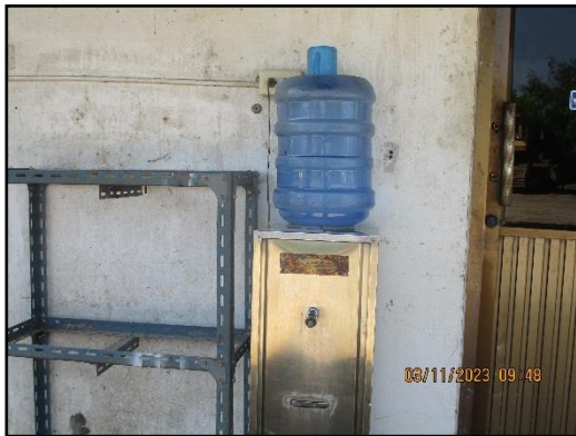
ภาพที่ 2.17 ตู้บริการน้ำดื่มภายในพื้นที่ โครงการ