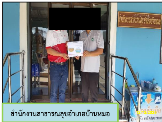
สำนักงานสาธารณสุขอำเภอบ้านหมอ