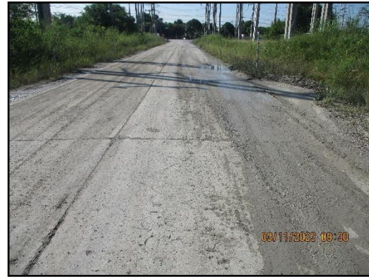
ภาพที่ 2.6 สภาพเส้นทางขนส่งแร่ (ส่วนบุคคล) ช่วงก่อนขึ้นสู่ทางหลวง