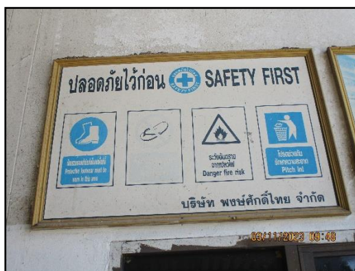
ภาพที่ 2.26 ป้ายเตือนบริเวณที่มีความเสี่ยงและกำหนดให้สวมใส่อุปกรณ์ป้องกันอันตรายส่วนบุคคล