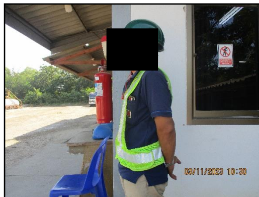
ภาพที่ 2.25 พนักงานสวมใส่อุปกรณ์ป้องกันอันตราย