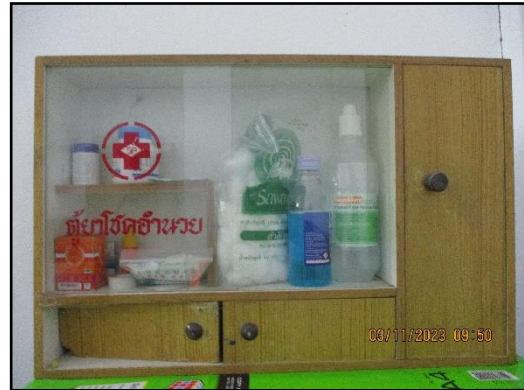
ภาพที่ 2.16 ตู้ปฐมพยาบาลเบื้องต้น ประจำโครงการ