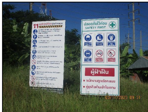
ภาพที่ 2.14 นโยบายความปลอดภัยอาชีวอนามัย และสิ่งแวดล้อมในการทำงาน