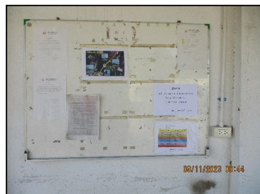
ภาพที่ 2.10 บอร์ดประชาสัมพันธ์ความรู้ต่างๆ ภายในพื้นที่โครงการ