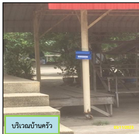
ภาพที่ 2.1 กล่องรับเรื่องราวร้องทุกข์