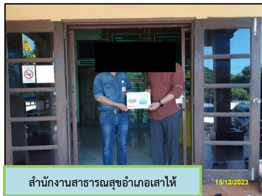
สำนักงานสาธารณสุขอำเภอเสนาไห้