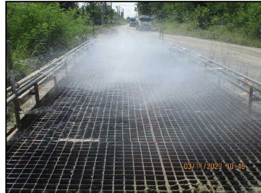
ภาพที่ 2.5 บ่อล้างล้อรถบรรทุกในช่วงถนนคอนกรีตของเส้นทางขนส่งแร่