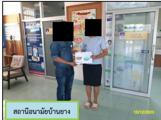
สถานีอนามัยบ้านยาง