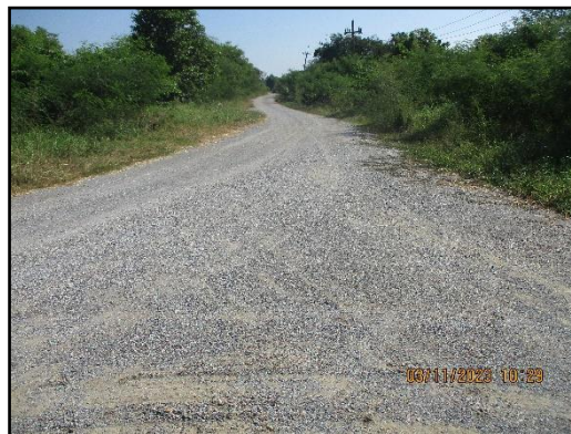
ภาพที่ 2.7 ถนนลาดยางที่เพิ่มไปยังขอบบ่อเหมืองเก่าของโครงการ