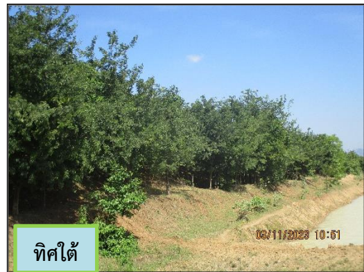
ภาพที่ 2.4 คั่นทำนบดินของพื้นที่โครงการ