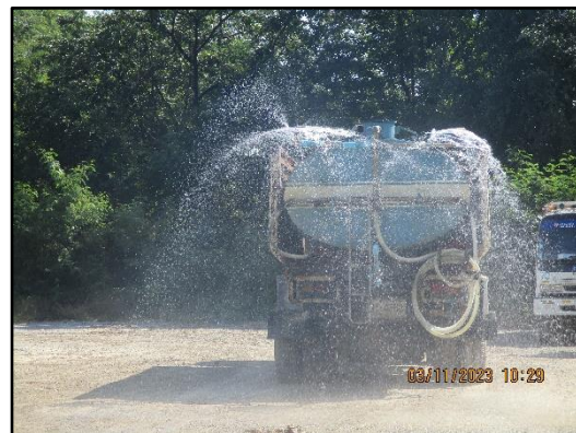
ภาพที่ 2.21 รถบรรทุกน้ำคอยฉีดพรมถนนภายในพื้นที่โครงการ